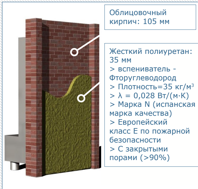
Рисунок 1: Испытательный образец шириной 1,2 м и высотой 2,4 м

жесткого пенополиуретана. В соответствии с данным стандартом можно провести испытание стены среднего размера (шириной 1,2 м, высотой 2,4 м и толщиной 105 мм), на одну из сторон которой (внутренняя поверхность) предварительно нанесли методом напыления жесткий пенополиуретан.