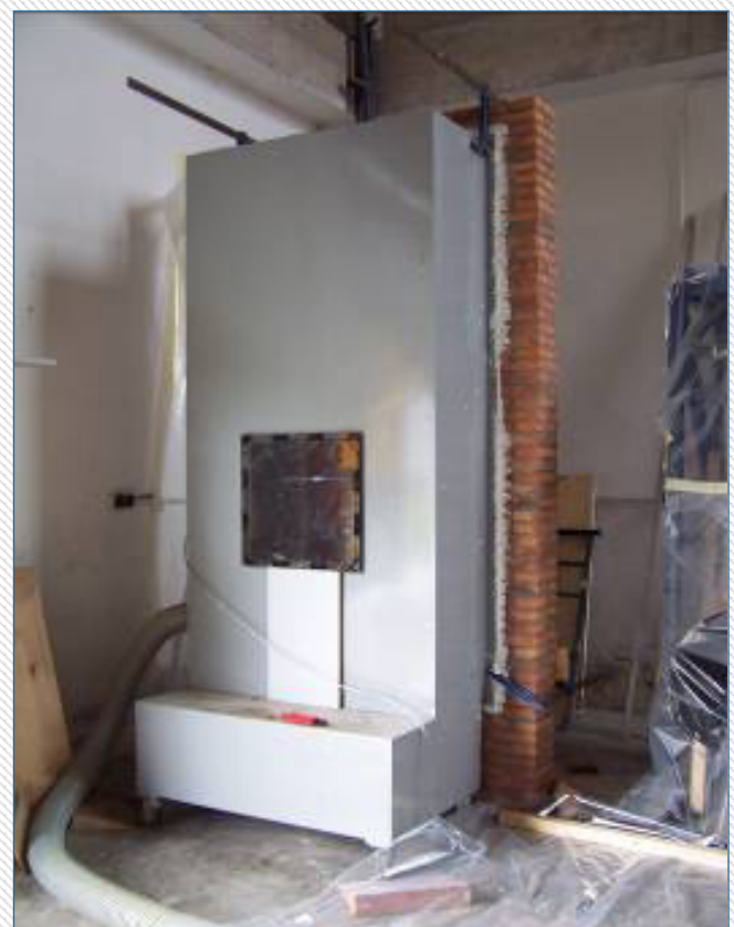
Рисунок 2: Камера давления, прикрепляемая к испытательному образцу стены